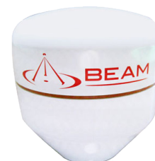
Antenne SAT GPS