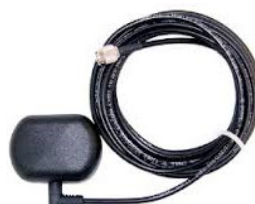
Antenne magnétique 5m