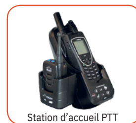
Station d'accueil PTT